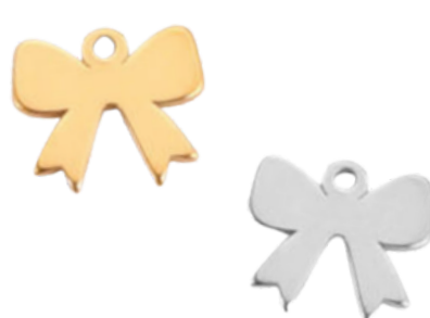
Ariane Fille du roi de Crète