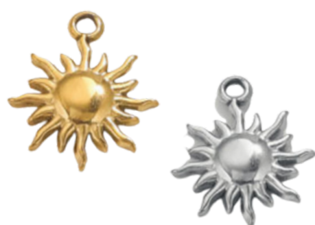
Théia Titanide de la vision