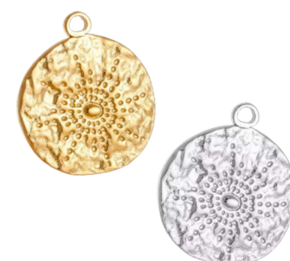
Héméra Déesse du jour