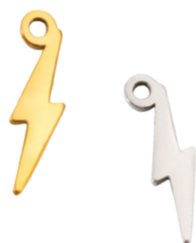
Zeus Dieux des Dieux