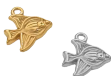
Glauco Divinité marine