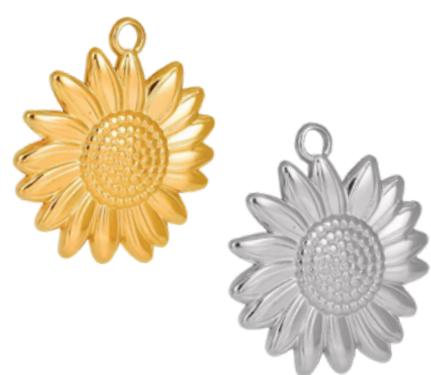
Déméter Déesse de l'agriculture