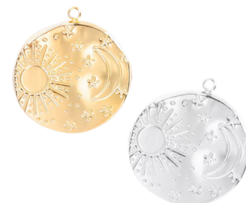
Endymion Simple berger