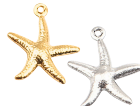
Thétis Divinité marine