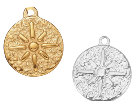
Éole Régisseurs des vents