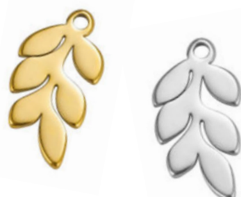
Dionysos Dieu du vin et de la fête