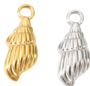
Néritès Divinité marine