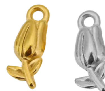
Anthéia Déesse du foyer

*En fonction des stocks, il est possible qu'un des éléments soit manquant. Il sera remplacé par un article aux caractéristiques similaires.