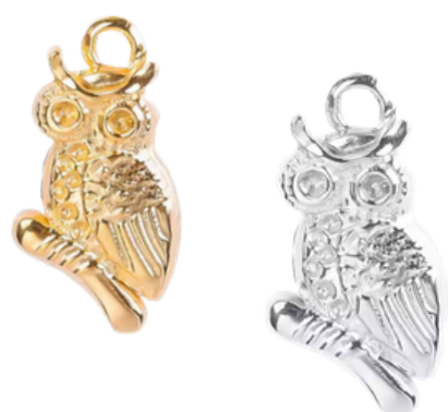
Athéna Déesse de la guerre