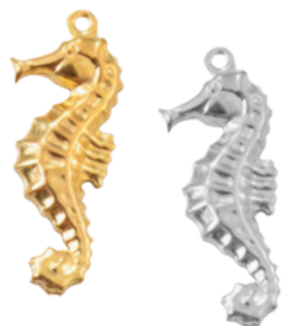
Hippocampe Cheval marin