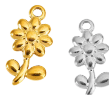
Perséphone Déesse du printemps