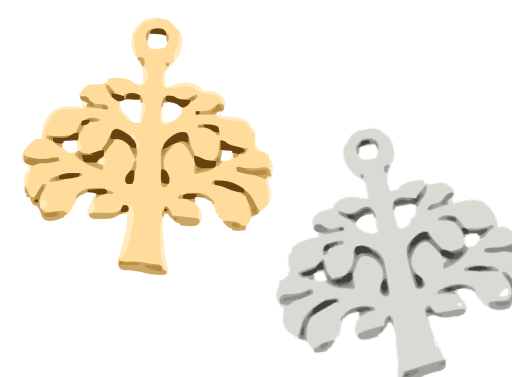
Hestia Déesse du foyer