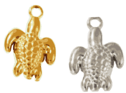
Chéloné Femme transformée par Zeus