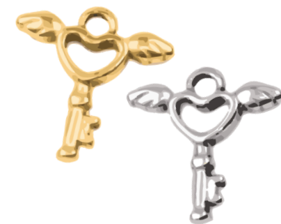
Hermès Messagers des Dieux