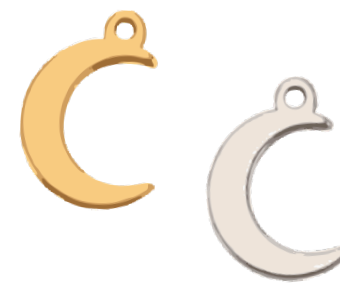
Hécate Déesse de la lune