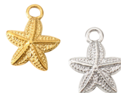
Nérée Dieu sage de la mer