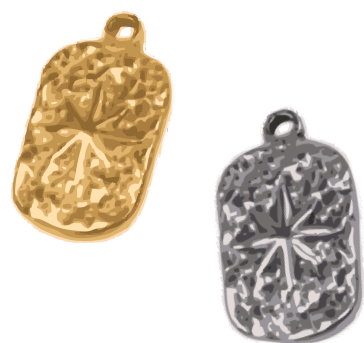
Nyx Déesse de la nuit