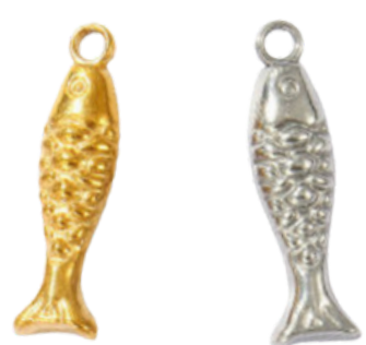
Doris Mère des Néréides