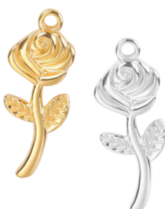
Héra Déesse du mariage