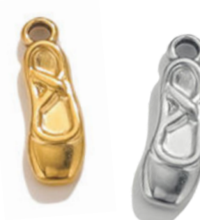
Terpsichore Muse de la danse