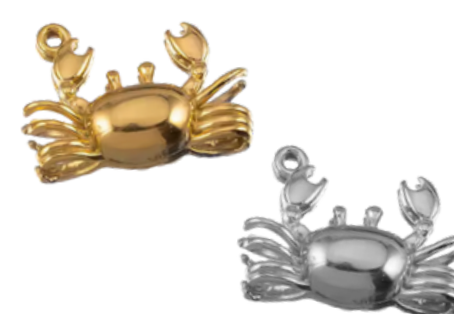
Karkinos Monstre marin