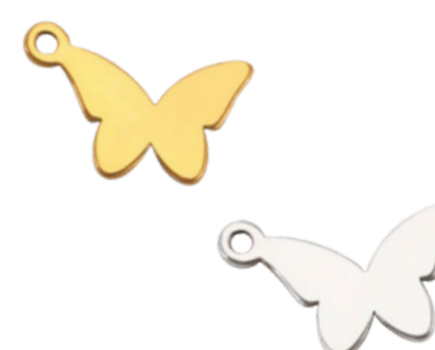
Psyché Déesse de l'âme